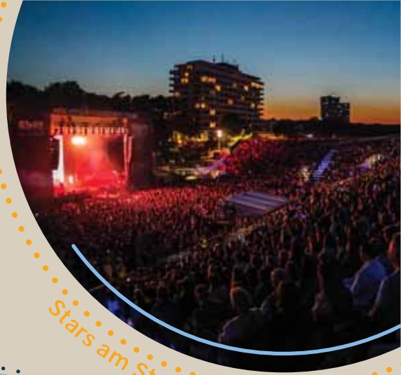
Stars am Strand